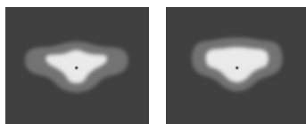
[T2] Тип II, Асимметричный, Боковой - 137x52°