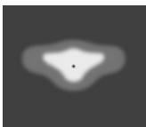
[T2] Тип II, Асимметричный, Боковой - 130x85°