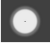
[SYM] Simetrik - 155