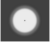
[SYM] Simetrik - 130